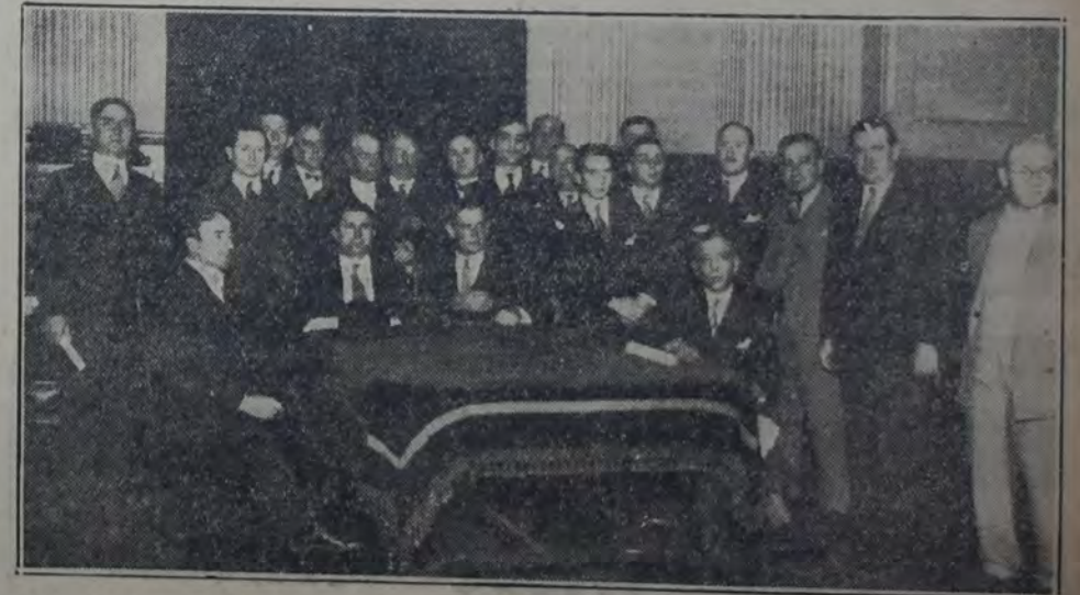
Los electores socialistas en antenas del Senado, antes de reunirse el Colegio Electoral.